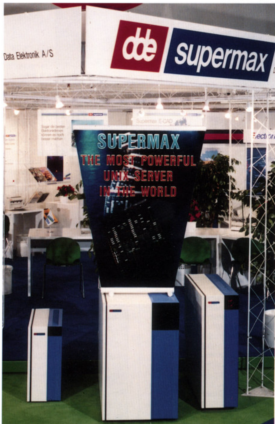
Supermax' verdensrekord blev lanceret på DDE's stand på CeBIT '93 i Hannover - verdens største edb-messe

Testene foretager bl.a. kalkulation af budgetmodeller i et regneark, C-oversættelse og automatisk design af elektronikkredsløb. Alle disse tests